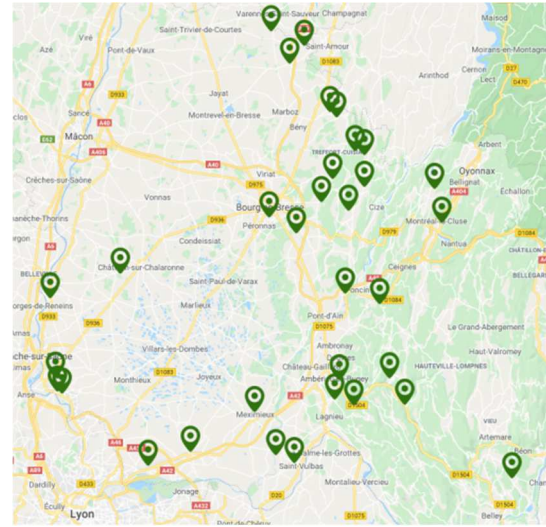
Carte : Nids de frelon asiatique détruits sur le département de l'Ain en 2019

Les conditions climatiques de l'année semblent avoir été défavorables au prédateur. Malgré tout, le frelon asiatique continue sa progression.