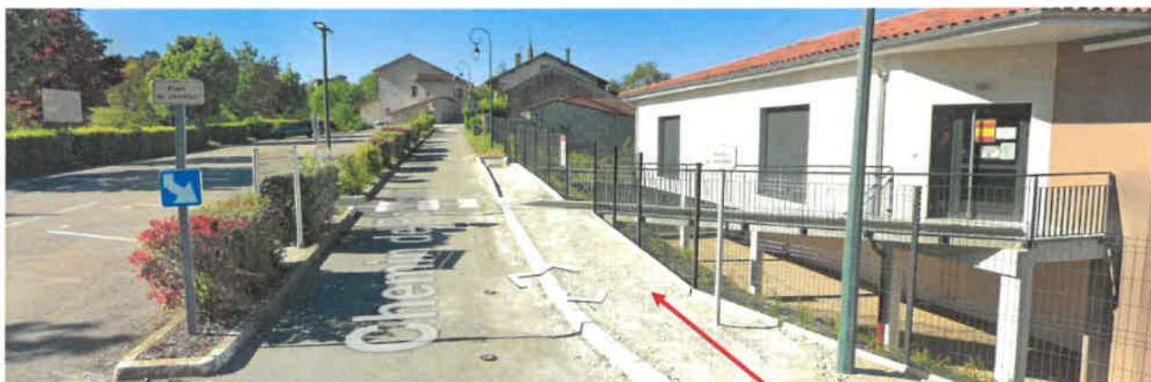
Entrée début zone rencontre

Un cheminement piéton a été instauré pour l'accès à l'école, dans le cadre du protocole sanitaire, de ce fait les parents et les enfants doivent repartir vers le parking en empruntant le trottoir côté école primaire puis l'accotement. Après étude, un passage pour piéton ne peut de ce fait pas être installé. En revanche, il est proposé de modifier le périmètre de zone de rencontre qui commence vers l'église pour se terminer après la fontaine du Village. Dans cette zone, les piétons sont autorisés à circuler sur la chaussée sans y stationner et bénéficient de la priorité sur les véhicules. La vitesse des véhicules est limitée à 20 km/h, toutes les chaussées sont à double sens pour les cyclistes. Ainsi, le périmètre de la zone de rencontre sera modifié et débutera vers le bâtiment périscolaire (espace Terre et Ciel).