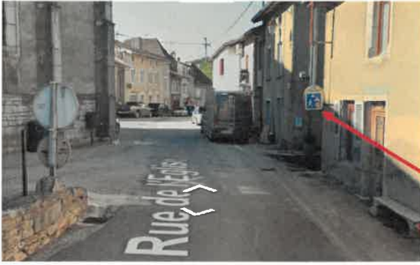
déplacement du panneau