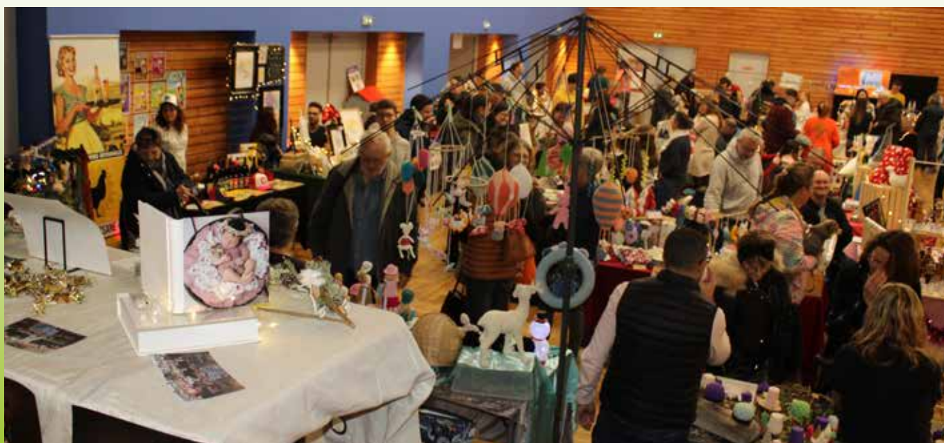
"Succès du marché de Noël où les 34 exposants, en priorité locaux, ont présenté des créations de qualité."

24 mai - vente d'un plat à emporter 27 juin - fête de l'été 23 septembre - assemblée générale 11 octobre - vente de fromages 6 et 7 décembre - marché de Noël le samedi, loto le dimanche.