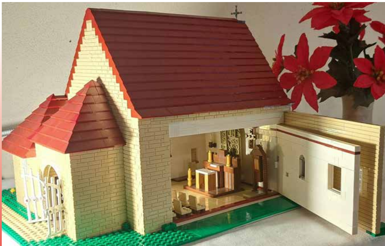
La Chapelle de l'Orme réalisée en lego (travail d'une année !) par Catherine Flack de Tossiat